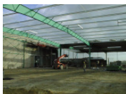
Montage Charpente et Maçonnerie