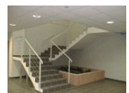
Escalier Accès Etage