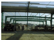
Pose Portique Charpente