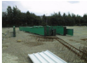
Préparation Portique Charpente