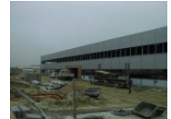
Montage Façade Bureaux