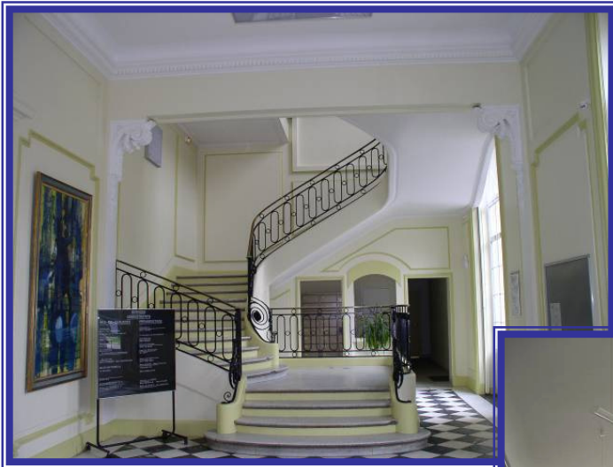
Hall d'entrée des logements du Château