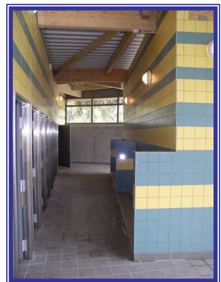
Sanitaires du Lycée