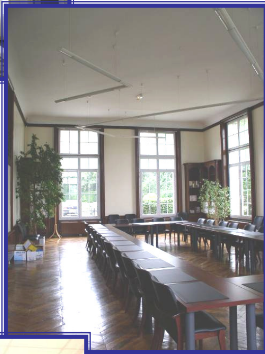
Salle de réunion du Château