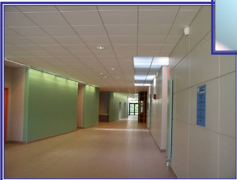
Liaison centrale Grande et petite salle