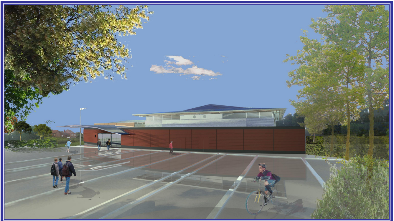
Vue virtuelle du gymnase avant travaux